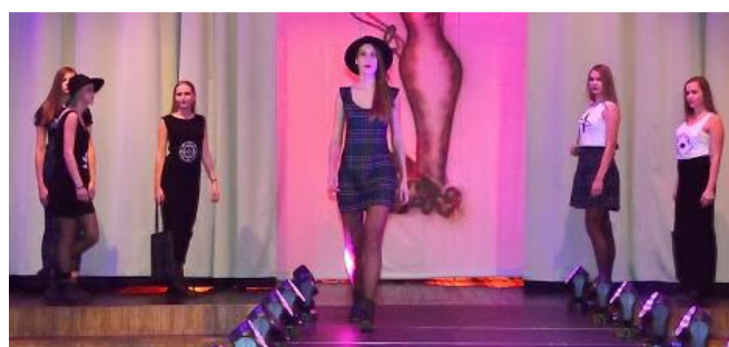
II koht 10.e ja 10.l klassi kollektsioon „Elephant“