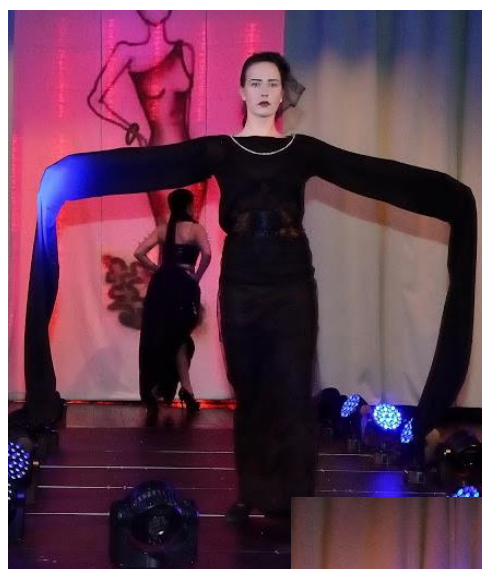
I koht 11. klasside kollektsioon „The wicked brides“