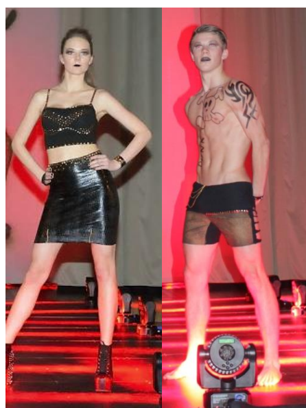
II koht 10.e ja 10.l klassi kollektsioon „Elephant“