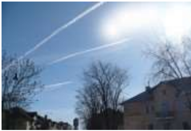
Joonis 1. Triibud taevas