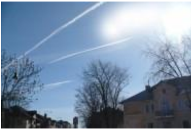
Joonis 1. Triibud taevas