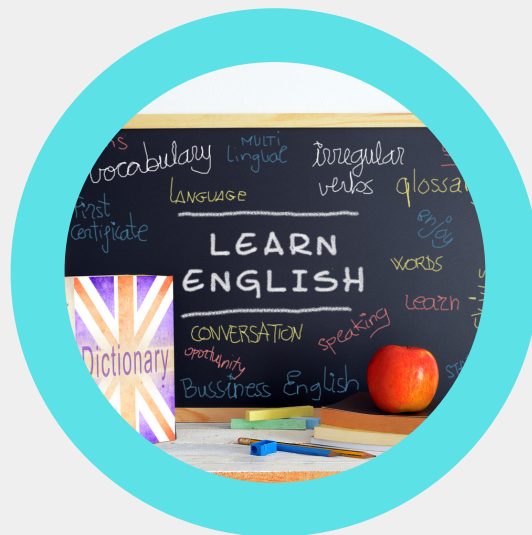
Inglise keele klass