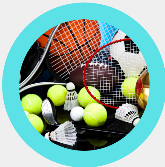
Spordi- ja muusikaklass