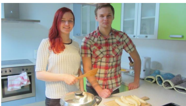
10. b klassi õpilased